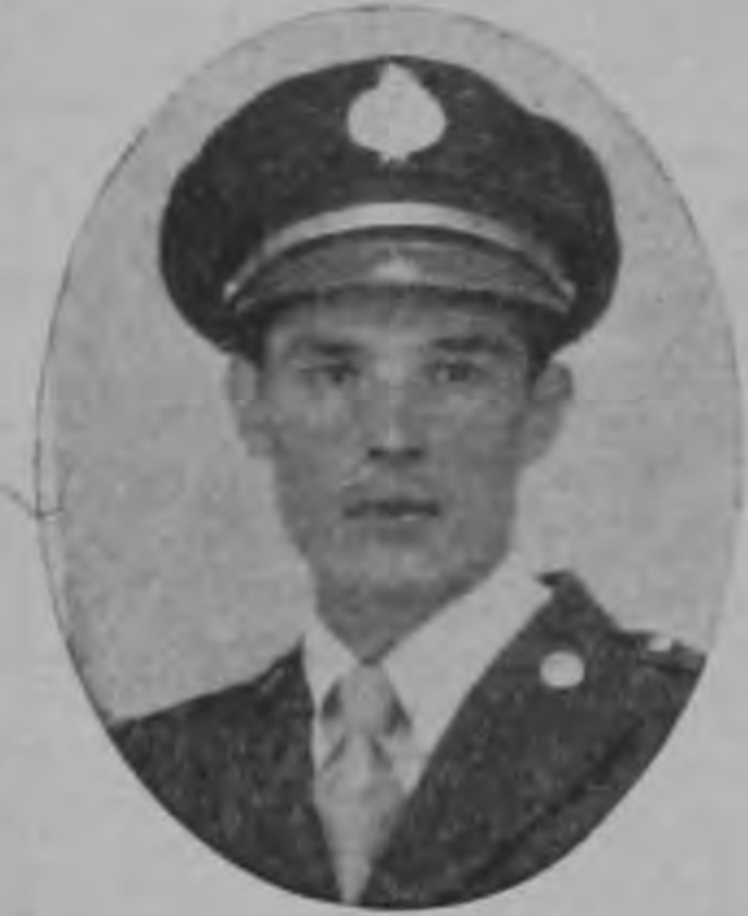
San José, 19 de Febrero de 1955

La asistencia a este acto comprometerá nuestra eterna gratitud.