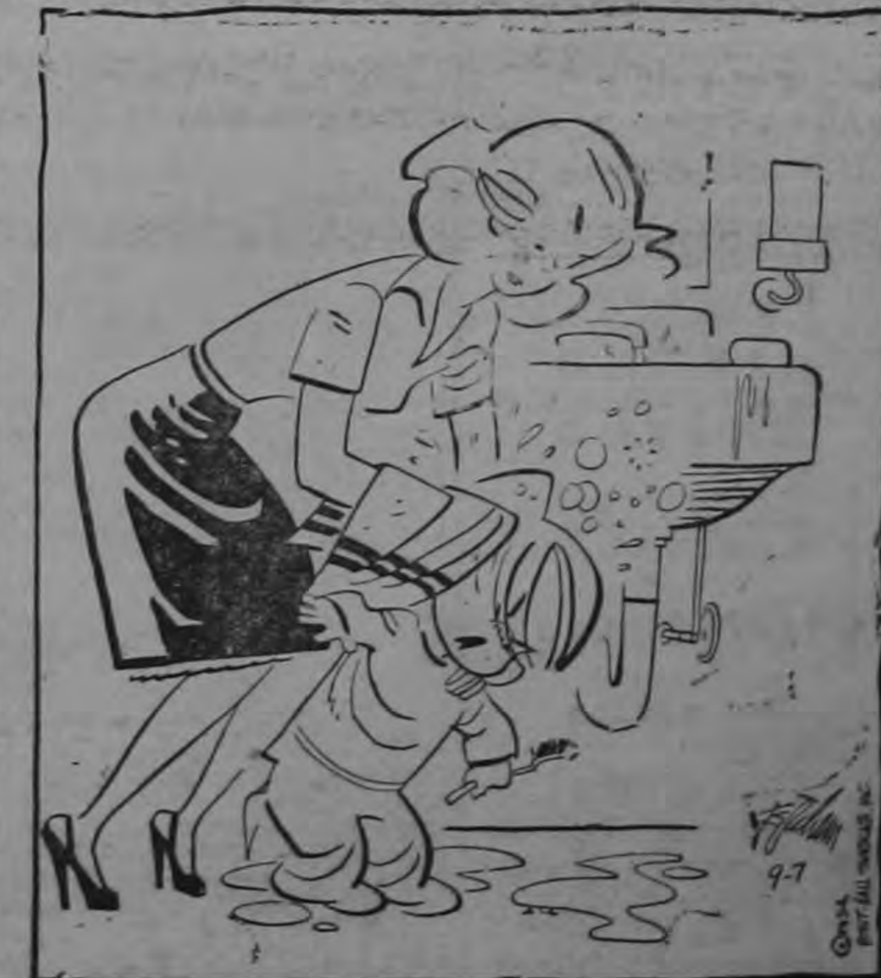
—¡Pero si la visita no viene hasta mañana!